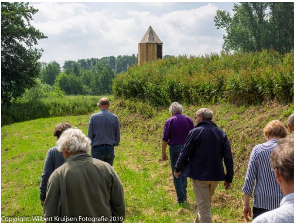
Tussen gracht en wal

In de buurtschap Weverslo van het dorp Merselo ligt een archeologisch terrein van een boerenschans uit de tijd van de middeleeuwen. Op de archeologische locatie is niets meer te zien, maar verderop heeft de Werkgroep Stichting de Rooyse Schans een nieuwe gelijksoortige boerenschans gebouwd.