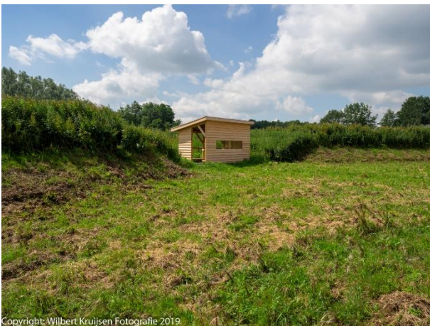
Bijental in aanbouw