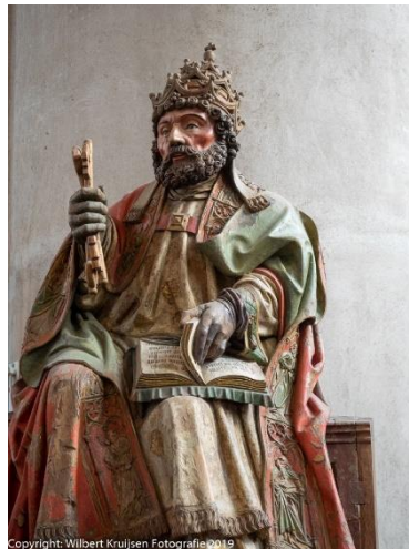
Sint Petrus Paulus