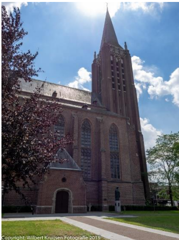
Sint Petrus Banden Kerk

Deze gotische kerk uit de 15 de eeuw is vooral bekend door zijn vele kunstschaten waaronder 90 hout gesneden beelden uit de 15 de en latere eeuwen. De Reformatie en beeldenstorm is Venray bespaard gebleven. De kerkschaten zijn bewaard gebleven. Bij bombardementen in 1944 is de kerk en zijn interieur zwaar beschadigd, maar de beelden zijn allemaal teruggevonden en gerestaureerd.