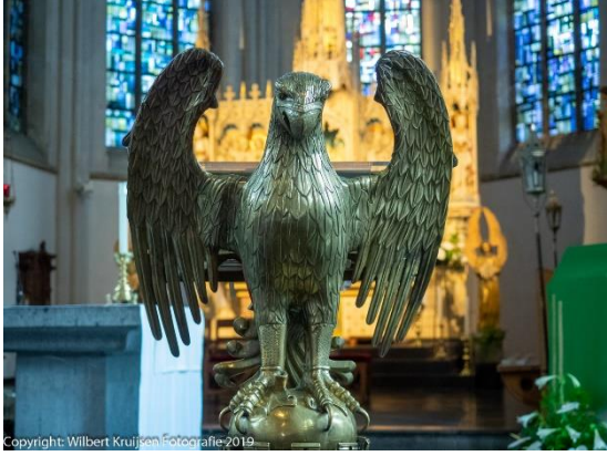
Lezenaar met adelaar